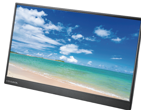
I-O DATA LCD-CF161XDB-M